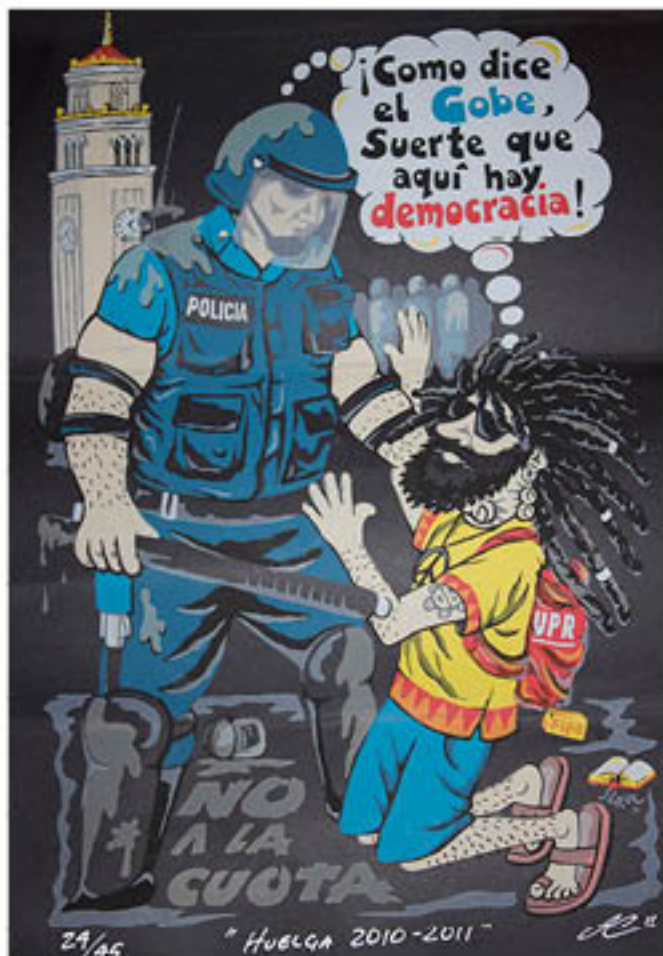
JAIME CRUZ, "MACHETERO" (Puerto Rico) Que vivan los estudiantes, 2011 Silkscreen, 11 1/2" x 17 1/2"